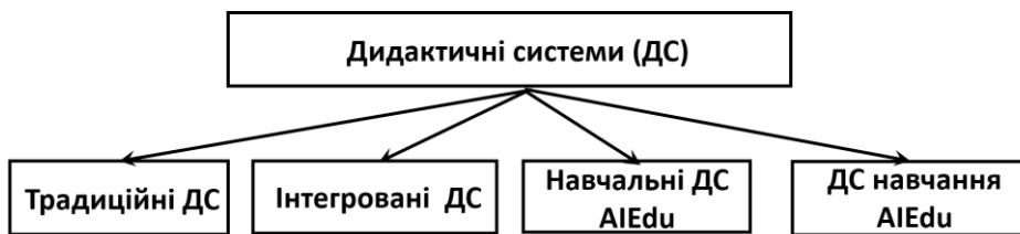
Рис. 2. Класифікація дидактичних систем, заснованих на AIEdu, де: ДС – дидактична система або група дидактичних систем

Базуючись на цьому критерії, розроблено класифікацію дидактичних систем (ДС), яку наведено на рис. 2.